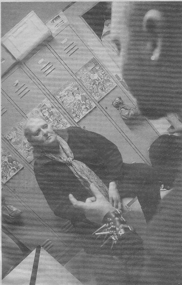
Die Therapeutin kann sich viel Zeit für einen Hilfesuchenden nehmen